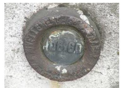
Un point de nivellement

Les dessins sur les côtés représentent les points de nivellement encrés sur des bâtiments ou des rochers à proximité de l'eau. Les dessins leur permettaient de les retrouver plus facilement, ils étaient indispensables car ils représentent une altitude précise (notée sur la carte).